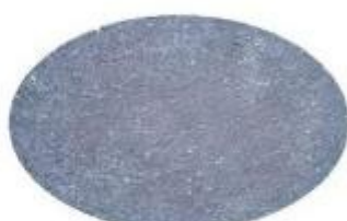
Tipo Pietra Lavica