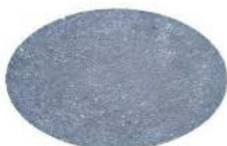
Tipo Pietra Lavica