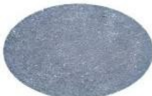
Tipo Pietra Lavica