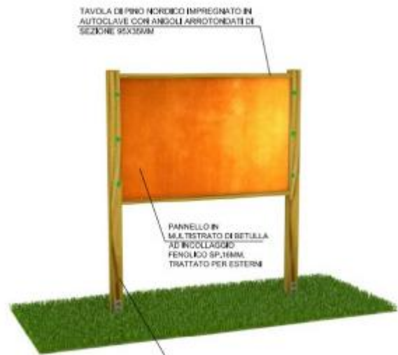
TAVOLA DI PINO NORDICO IMPREGNATO IN AUTOCLAVE CON ANGOLI ARROTONDATI DI SEZIONE 95X36MM

PANNELLO IN M.L.E. TRATTATO DI RETELLA "AD INCOLLAGGIO" FENOLICO SP.16MM TRATTATO PER ESTERNO